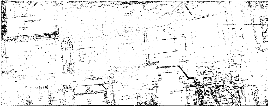
Схема проведения муниципальной ярмарки «Праздничная» на Центральной площади г. Ижевска 19 августа 2018 года

Утверждены постановлением Администрации г. Ижевска от 10.08.2018г. № 1039