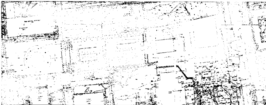
Схема проведения муниципальной ярмарки «Праздничная» на набережной Ижевского пруда 19 августа 2018 года